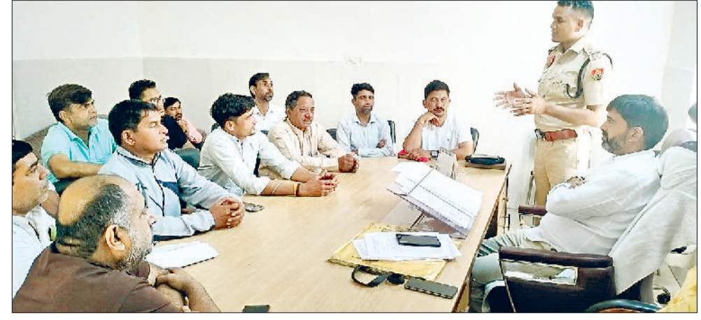
बवानीखेड़ा। पार्श्वों को संबोधित करते थाना प्रभारी।