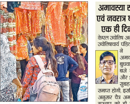
भिवानी। सराय चौपाटा स्थित दुकान पर नवरात्र की पूजा अर्चना के लिए मां दुर्गा की प्रतिमा व सामान खरीदती श्रद्धालु।