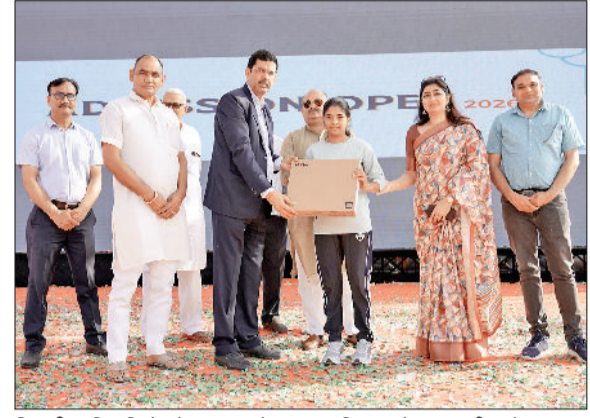
भिवानी। प्रतिभागियों को पुरस्कार देकर सम्मानित करते हुए व परीक्षा के वक्त स्कूल परिसर में उपस्थित अभिभावक।

कार्यक्रम में 3500 विद्यार्थियों ने उत्साहपूर्वक भाग लिया