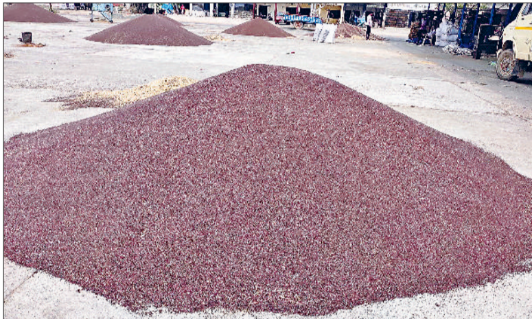
भिवानी। अनाजमंडी में लगी सरसों की ढेरी।