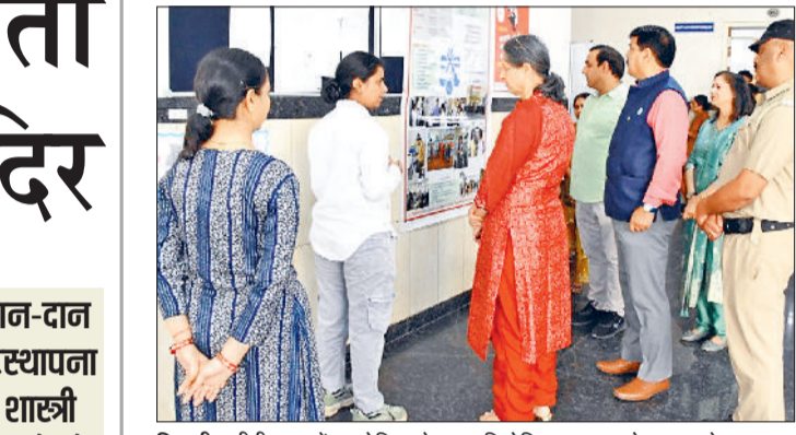
भिवानी। सीबीएलयू में आयोजित पोस्टर प्रतियोगिता का अवलोकन करते हुए।

■ "पर्यावरणीय स्थिरता और हरित भविष्य में जैव प्रौद्योगिकी की भूमिका" विषय पर पोस्टर प्रतियोगिता का आयोजन