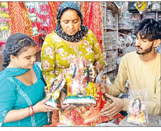
भिवानी। सराय चौपाटा स्थित दुकान पर नवरात्र की पूजा अर्चना के लिए मां दुर्गा की प्रतिमा व सामान खरीदती श्रद्धालु।