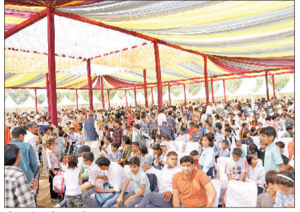
भिवानी। प्रतिभागियों को पुरस्कार देकर सम्मानित करते हुए व परीक्षा के वक्त स्कूल परिसर में उपस्थित अभिभावक।