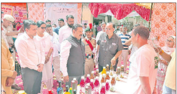
चरखी दादरी। कार्यक्रम में स्टॉल का अवलोकन करते डीसी।

पूरे देश में बेहतरीन कार्य करने वाले चयनित 50 जिलों में शामिल आकांशी ब्लॉक को लेकर पिछले एक सप्ताह से कार्यक्रमों का आयोजन किया जा रहा है। इन कार्यक्रमों के माध्यम से संबंधित विभागों के अगले चरण के लिए लक्ष्य निर्धारित किए गए हैं। साथ ही लोगों को जागरूक भी किया गया। उपायुक्त डॉ. मुनीश नागपाल मंगलवार को एक बार फिर से कार्यक्रम पहुंचे और संबंधित विभागों को और बेहतर तरीके से कार्य करने की सलाह दी। उन्होंने कहा कि संबंधित अधिकारियों एवं